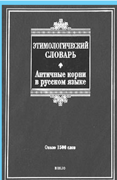
Этимологический словарь. Античные корни в русском языке. Ильяхов А.Г.: 2010 ИЗД-ВО «АСТ» Москва, 672 с.

Словарь в доступной форме раскрывает происхождение и значение слов русского языка, имеющих античные корни. Показывает, какое влияние оказали античные языки на русский язык.